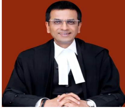
माननीय न्यायमूर्ती (डॉ.) धनंजय यशवंत चंद्रचूड भारताच्या सर्वोच्च न्यायालयाचे मुख्य न्यायाधीश आणि महाराष्ट्र राष्ट्रीय विधी विद्यापीठ मुंबई, चे कुलपती